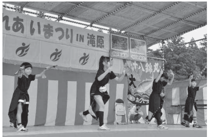
▼乱舞キッズによるよさこいソーラン