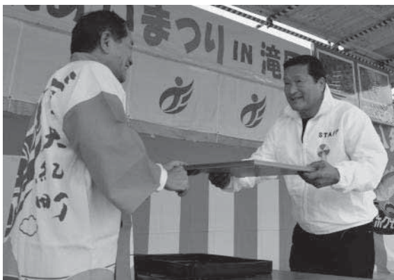
▲まつりでのステージ設営等にご尽力をいただいた三建会に感謝状の贈呈