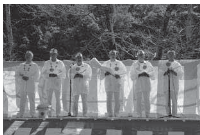
赤船連による木やり