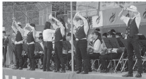
▲相可高校ブラスバンド演奏