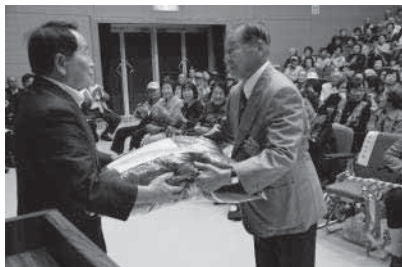
米寿座布団の贈呈