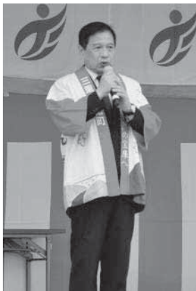
▲三ツ矢衆議院議員あいさつ