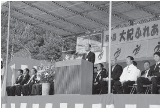
▲議会副議長による開会宣言