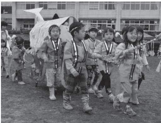
元気いっぱい子どもみこし