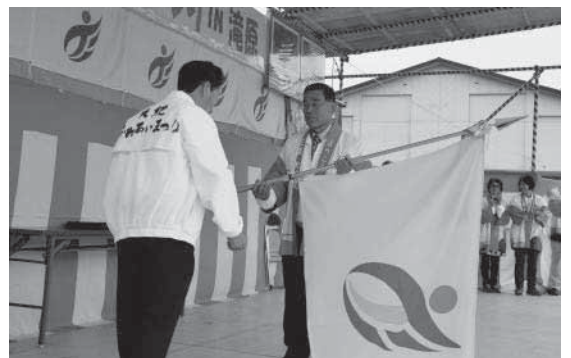
▲次回開催地(七保地区)へ町旗の伝達