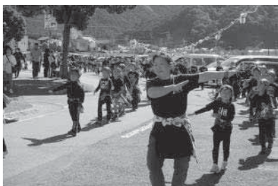
手踊り(ザ・ニシキ)