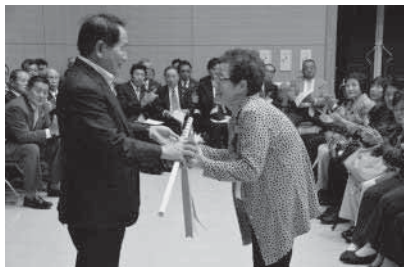
延寿杖・湯呑の贈呈

また、式典のあと、演歌歌謡ショーや夫婦漫才などのアトラクションがあり、楽しい日を過ごしました。