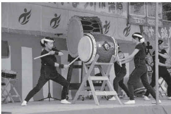
▲創心太鼓による和太鼓演奏