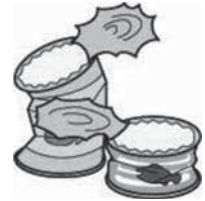
さびた缶やつぶれた缶