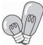
電球(球型の蛍光灯 との区別に注意)