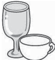
ガラスや陶器の食器