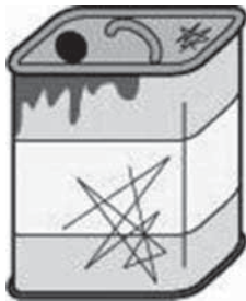
一斗缶の大きさの缶 は不燃類