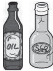
食用油のビンやドレッシングのビン