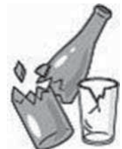
ビンは割れたもの なら不燃類