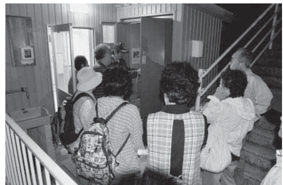
避難所で発電機の操作方法の説明を受ける参加者。

この避難訓練は、昼夜を問わず発生する大地震に備え、夜間の津波発生を想定したもので、午後7時の防災行政無線による放送を合図に住民の方々が避難袋や懐中電灯を手にして、一斉に最寄りの避難所へ避難しました。