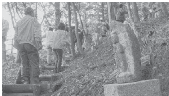
三十三体の観音菩薩像