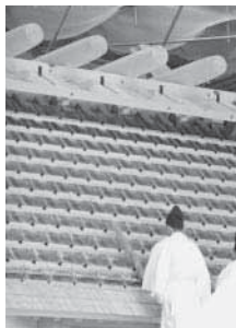
屋根の上に最初のカヤを置く様子

屋根に萱を葺く作業の開始にあたり、作業の安全と作業がうまくいくように祈願する儀式で、祭典では、萱葺工2人が屋根に上り、最初の萱を置く所作を行いました。