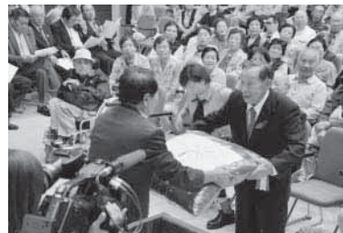
米寿座布団の贈呈

9月27日と28日 コンベンションホールで、70歳以上の方を対象とした敬老会が行われ、式典のあと歌謡ショーや夫婦漫才、演歌浪曲などのアトラクションで楽しい一日を過ごしました。