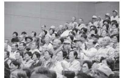
アトラクションを楽しむ皆さん