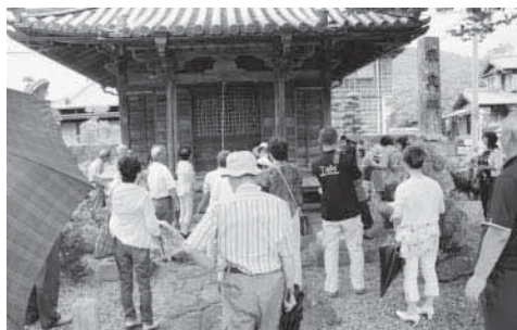
(左)天保以前に建てられた阿曾観音堂

この日は、藤の宝泉院の熊野観心十界曼荼羅と阿弥陀如来及び両脇侍像、阿曾の石灰華と阿曾観音堂、崎の山崎邸、錦の三角縁神獸鏡と海獸葡萄鏡、大内山の中組常夜灯を見学しました。