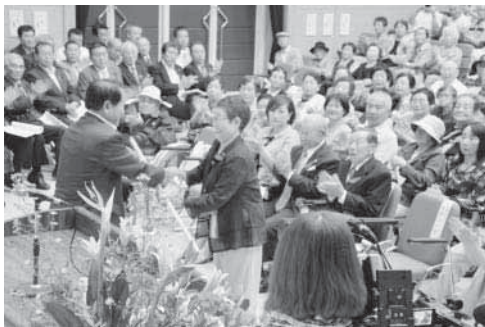
じんぐうえんじゅつえ 神宮延寿杖 湯呑の贈呈

9月27日と28日 コンベンションホールで、70歳以上の方を対象とした敬老会が行われ、式典のあと歌謡ショーや夫婦漫才、演歌浪曲などのアトラクションで楽しい一日を過ごしました。