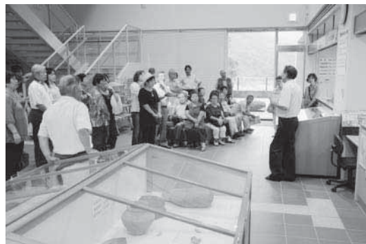
(右)役場錦支所のロビーに展示されている三角縁神獸鏡と海獸葡萄鏡の説明を聞く委員