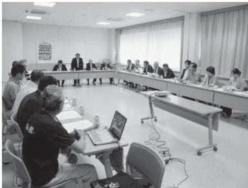
「木の駅プロジェクト」視察の様子

それぞれの視察先において、担当者や現場職員と活発な意見交換が行われ、視察を終えた大西議長からは「今後、大紀町が取り組むべき事案について調査ができた。この成果を町の発展につなげていきたい」と話がありました。