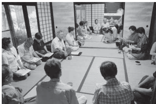
山崎邸(武家屋敷)の歴史について説明を聞く委員

9月17日 文化協会、文化財調査委員会の皆さんが町指定文化財等の見学会を行いました。