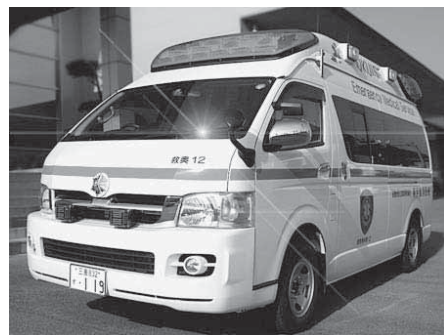
高規格救急自動車