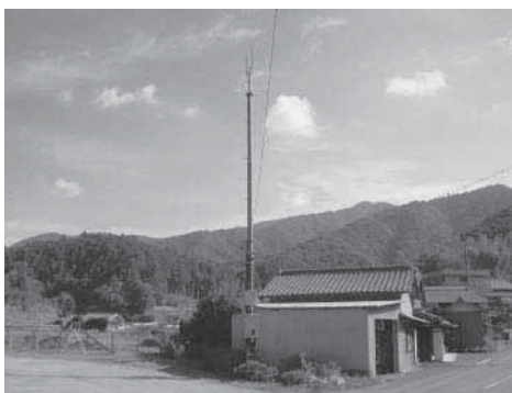
◀木屋集会所の隣にあります。

平成21年度 町単独事業 移動通信用鉄塔施設整備事業により、平成21年12月18日から永会木屋地区に、NTTドコモ東海のエリアが拡充され、携帯電話の通信サービスが開始されました。 ※au・ソフトバンクに関する通信サービスは不感帯地区です。