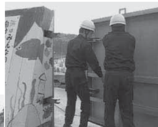
▲ 防潮扉を閉める様子