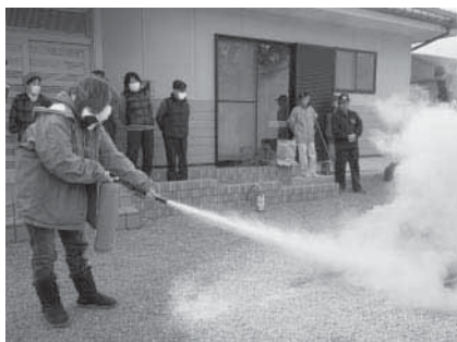
◀ 消火器訓練の様子

当日はサイレンを合図に災害対策本部が設置され、避難所での避難人員の確認や情報伝達活動、各地区で防災備品の点検や取り扱いの訓練などが行われました。