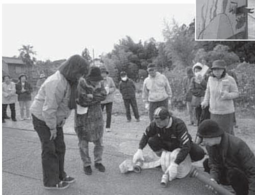
▲ 消防用ホースの使い方を確認

住民一人ひとりが日ごろから災害に備え、訓練を通じて防災を身近に感じ、近い将来に起こるといわれている東海・東南海・南海地震に備え、防災意識を高めましょう。