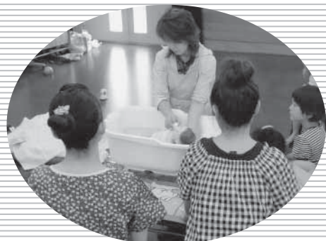
▲パパママ教室(沐浴体験)