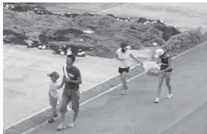
道路沿いの清掃活動