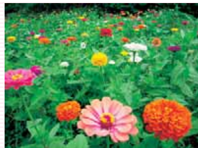
▲▼柏崎出張所近くの遊休農地に植えられた百日草