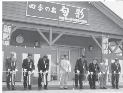
▲四季の店「旬彩」オープン記念のテープカット

新鮮な野菜や趣味・工芸品等地域の特産品を販売する四季の店「旬彩」が阿曽温泉前にオープンしました。当日は、阿曽温泉3周年記念祭、阿曽区「春まつり」の合同イベントが行われ晴天の下、大勢の人で賑わいました。