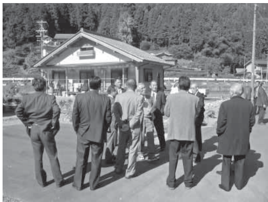
農園付きコテージで説明を受ける様子(白川町)

2日目の白川町は、豊かな自然、人口、面積等大紀町と似ており、「東濃ひのき」などの特産品を中心とした農林業に力を入