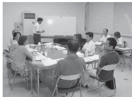
「推進委員会：大綱策定作業の様子」

第2回目となる推進委員会では、行政改革大綱の方向性や具体的な重点項目等について協議がなされ、改革推進事項の洗い出しに続き、その基本的な柱立て・枠組みづくりについて活発な話し合いがなされました。