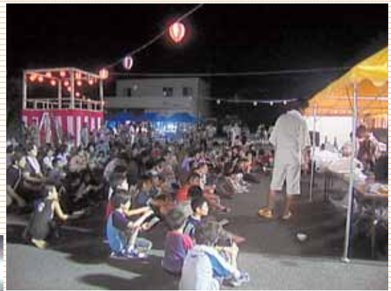
豪華賞品をかけたのスーパービンゴ大会と盆踊り大会 8月16日(木)(大内山地区夏祭り)