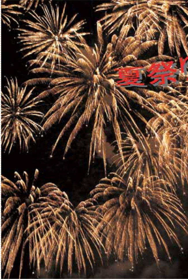
夏の夜空を彩る花火 8月15日(水)(錦地区花火大会)