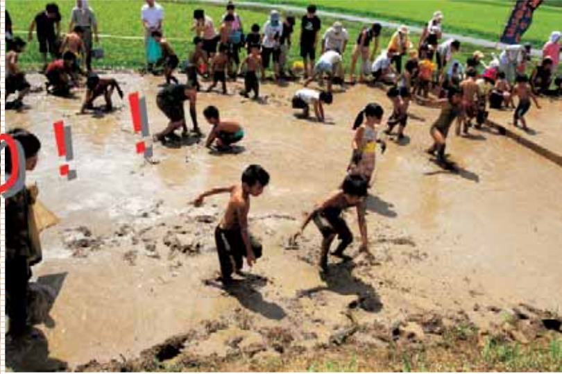
子どもたちが泥まみれになって追いかける「うなぎつかみ大会」8月14日(火)(阿曾夏祭り)