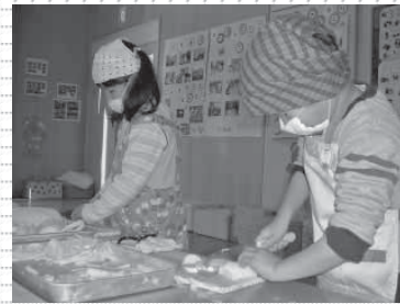
▲切干ダイコン作り