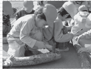
▲菌床シイタケ栽培センターを見学後、保育園でシイタケの菌打ち体験