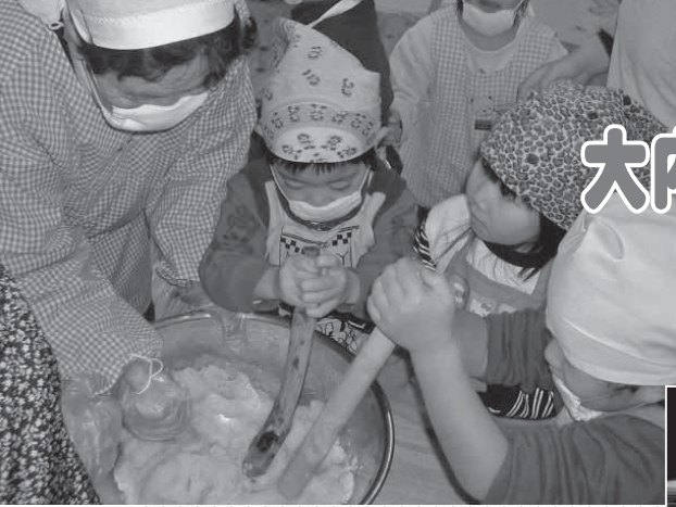
▲お年寄りと鍋もち作り