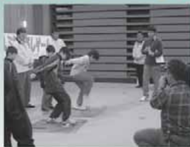
▲ドキドキ生放送中(みなとホールにて)

アルミ缶を片足でつぶし、つぶした缶の厚さ・直径を計測して順位を競う若者男女問わず参加できるゲームで、公式ルール、そして世界記録もあります。本部は大紀町にあり、日本各地やアメリカにも支部を持つ国際的な団体です。ただ単に遊ぶだけではなく、アルミ缶回収を行うことで環境保全に貢献し、つぶしたアルミ缶は提携している業者に高い値で引き取ってもらい、収益金や参加者による募金を福祉のために役立てています。様々なイベントに参加しているので、見かけたらボランティア精神とゲーム感覚で、みなさんも挑戦してみてくださいはいかがですか？