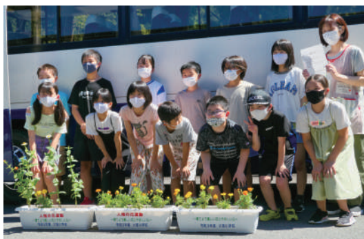
子育て支援センター「きらり」にて

5月に種をまき、児童たちが協力して、毎日水やりなどの世話をを行い、咲かせたきれいな花を、「育てよう美しい花とやさしい心」と書かれたプランター30基に植替え、各福祉施設にメッセージを添えて贈りました。