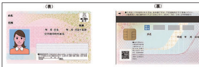
【マイナンバーカード】