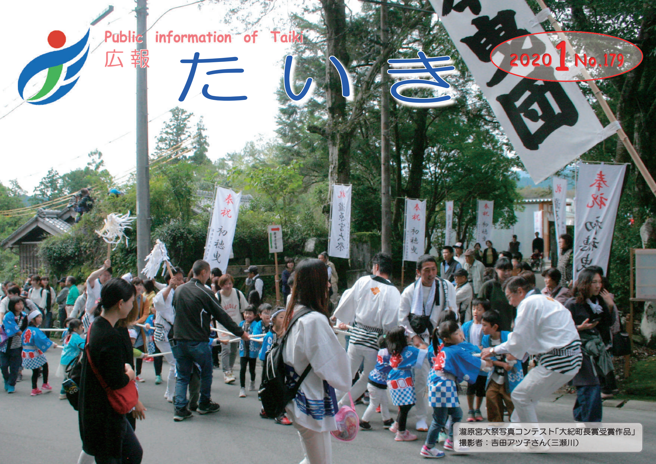
瀧原宮大祭写真コンテスト「大紀町長賞受賞作品」