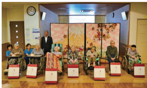
谷口町長と大宮園の100歳以上の皆さん