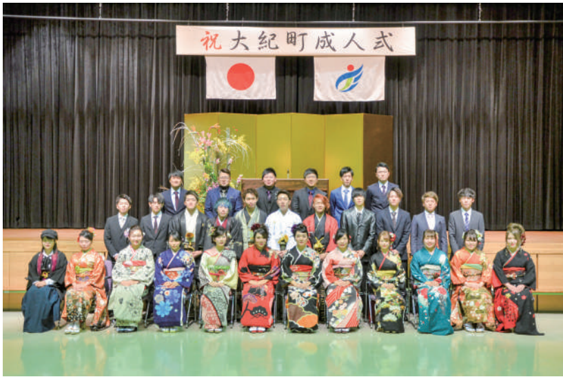
▲紀勢・大内山地区