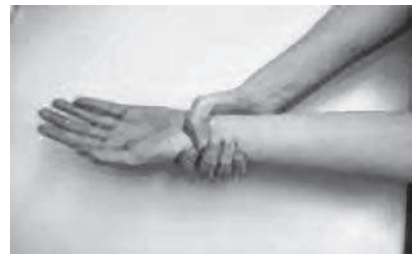
⑥手首をねじるように洗う

⑥までを行ったら、流水で石けんの泡を十分に洗い流します。最後に清潔なタオルやペーパータオルで拭きます。