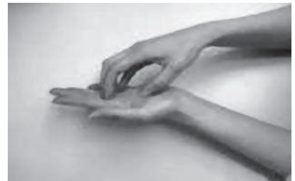
③指先と爪の間をこする