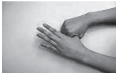
⑤親指の周りはねじるように洗う