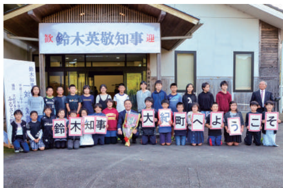
七保小学校の児童との記念撮影