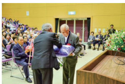
米寿座布団の贈呈