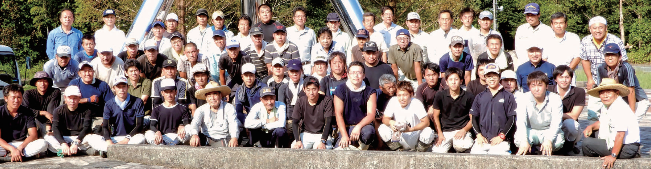
ガンバル男子職員!! 滝原公園の清掃作業(3日間)