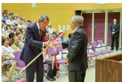
延寿杖・湯呑の贈呈

式典のあとは、浪曲、演歌劇場、漫才、演歌ショーのアトラクションがあり、楽しい1日を過ごしました。