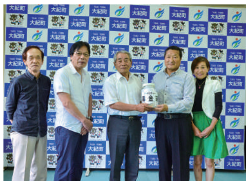
谷口町長と歌楽会の皆さん