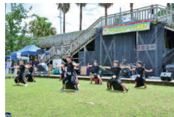
乱舞キッズによる踊り