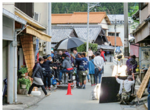
映画撮影現場の様子