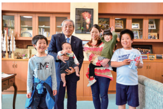
谷口町長と大西さんご家族