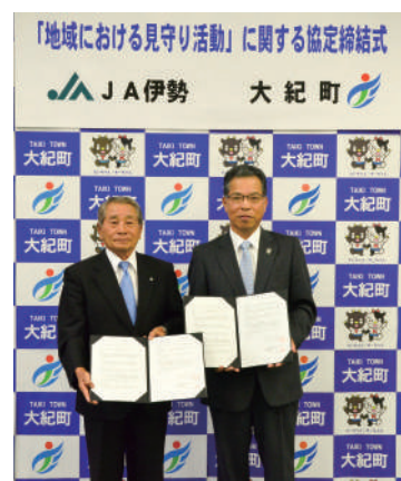
谷口町長と西村常務理事