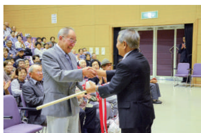
延寿杖・湯呑の贈呈

式典のあとは、歌謡ショーや夫婦漫才などのアトラクションがあり、楽しい1日を過ごしました。