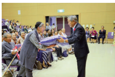
米寿座布団の贈呈