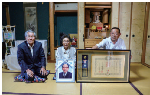
左から、谷口町長、妻のきよさん、長男の熊郎さん