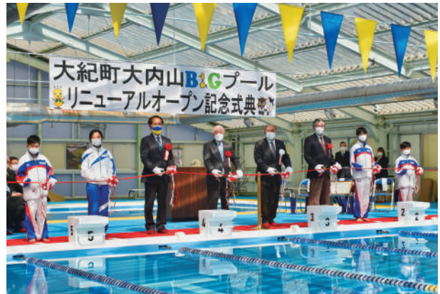
大内山B&G海洋センタープール