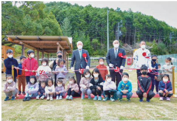
滝原ふれあいの里公園

3月27日 滝原ふれあいの里公園とテニスコートが完成し、竣工式が行われました。みなさまの憩いの場としてご活用ください。また、同日、大内山B&G海洋センタープールのリニューアルオープン式典も行われました。プールは、健康の維持増進にぜひ、ご利用ください。