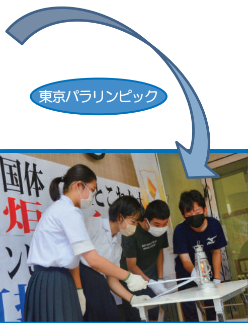
東京パラリンピック