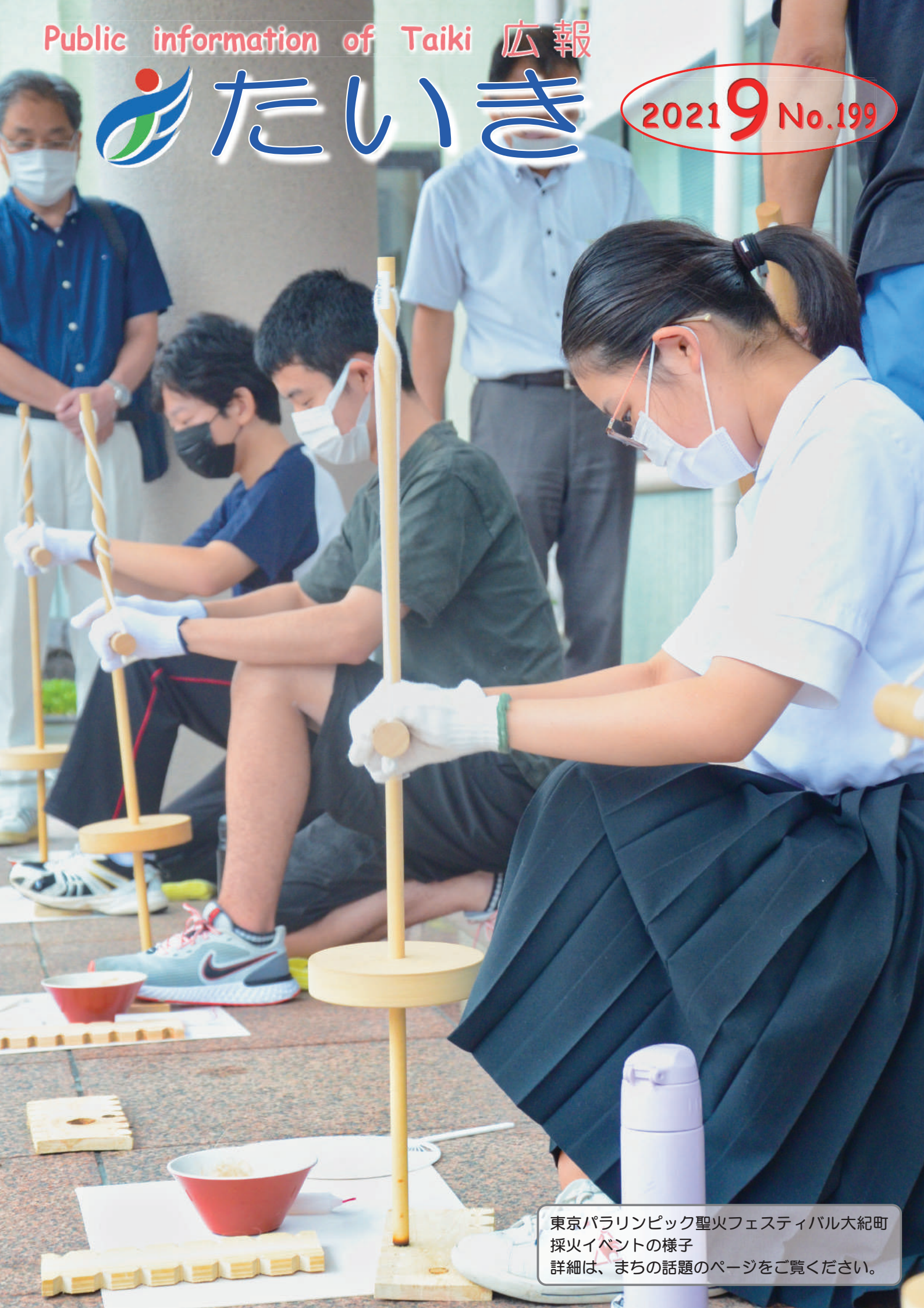
東京パラリンピック聖火フェスティバル大紀町採火イベントの様子 詳細は、まちの話題のページをご覧ください。