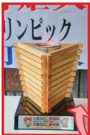
三重とこわか国体 三重とこわか大会