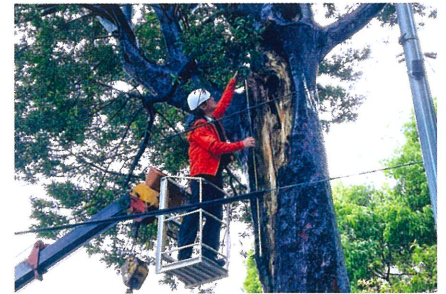
樹木健康診断(亀山市 関神社)