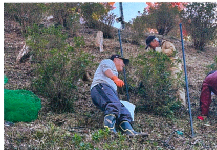
緑の募金交付事業(多気町 丹生区自治会)