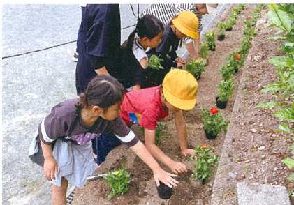
春期緑化運動(大台町 川添小学校)