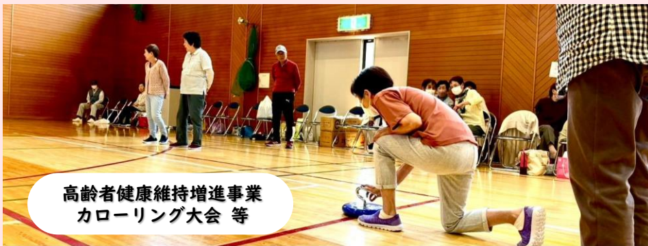
高齢者健康維持増進事業 カローリング大会等