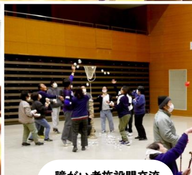
障がい者施設間交流 運動会