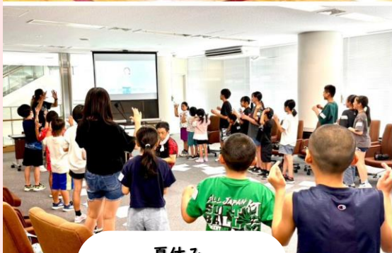
夏休み ボランティア体験教室