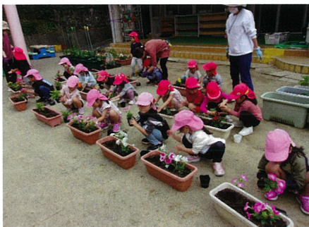
春期緑化運動(志摩市 立神保育所)