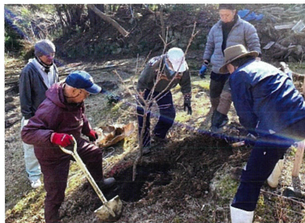
緑の募金交付事業(鳥羽市 金毘羅宮鳥羽分社崇敬講)