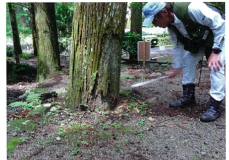
樹木健康診断(津市一志町 矢頭中宮キャンプ場)