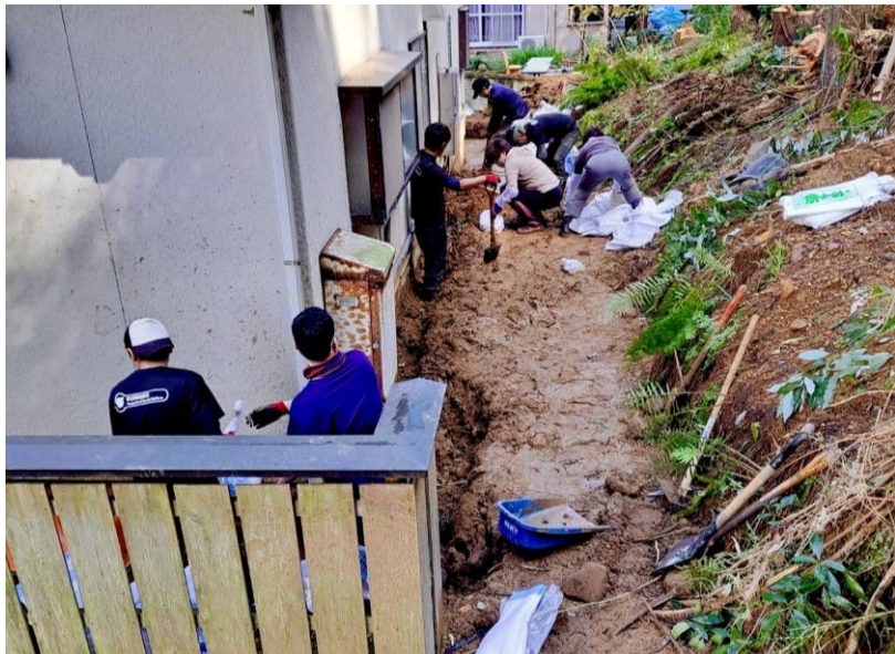
自宅裏山の法面崩落による土砂の撤去

令和6年9月20日からの大雨により、石川県輪島市では甚大な被害を受けました。この災害を受け、多気郡・度会郡の7つの社協（多気、明和、大台、玉城、度会、南伊勢、大紀）が合同で災害ボランティアとして現地支援活動に参加しました。