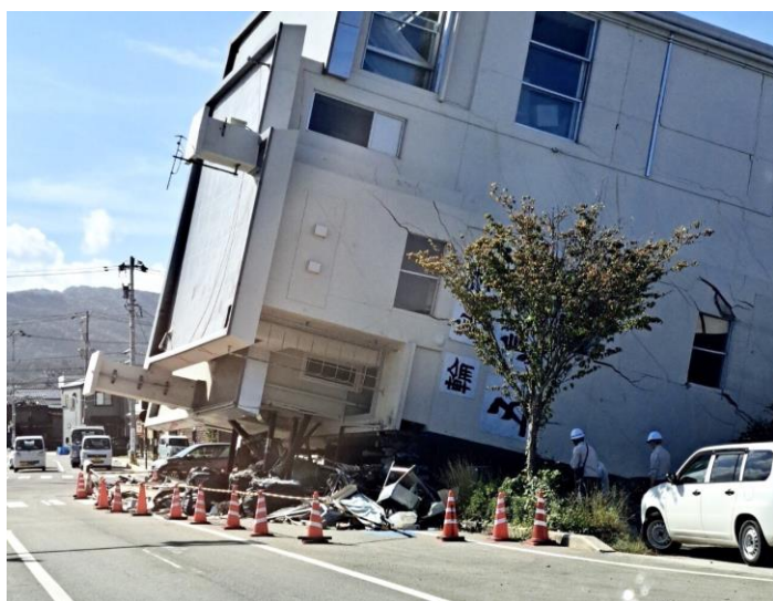
10月時点では建物の復興はほとんど進んでいない様子 (写真の倒壊したビルは昨年末に解体工事が進み現在は道路も通行可能です)

支援活動に参加した職員の話によると、「現地で印象的だったのは、地震発生から半年以上が経過しているにもかかわらず、建物の復興がほとんど進んでいない状況で、この現状に驚くとともに、被災地の厳しい現状を目の当たりにし、継続的な支援の重要性を改めて実感した」と話していました。 被災地では、まだまだ多くの課題がありますので、皆さまには引き続き温かいご支援をお願い申し上げます。