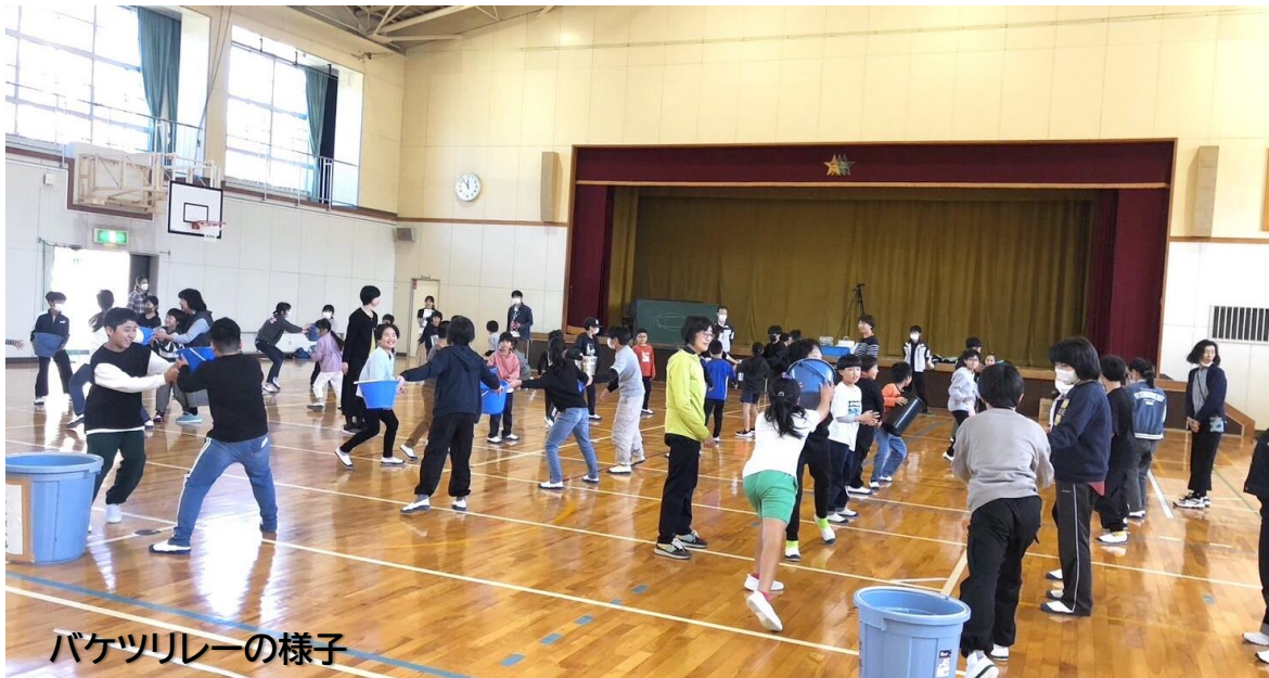
バケツリレーの様子