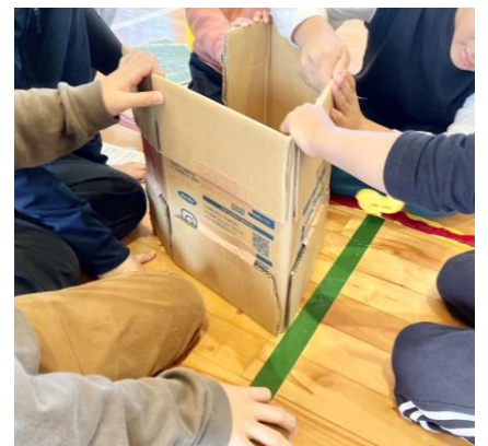
簡易トイレ作成の様子