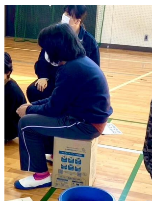
簡易トイレの完成品