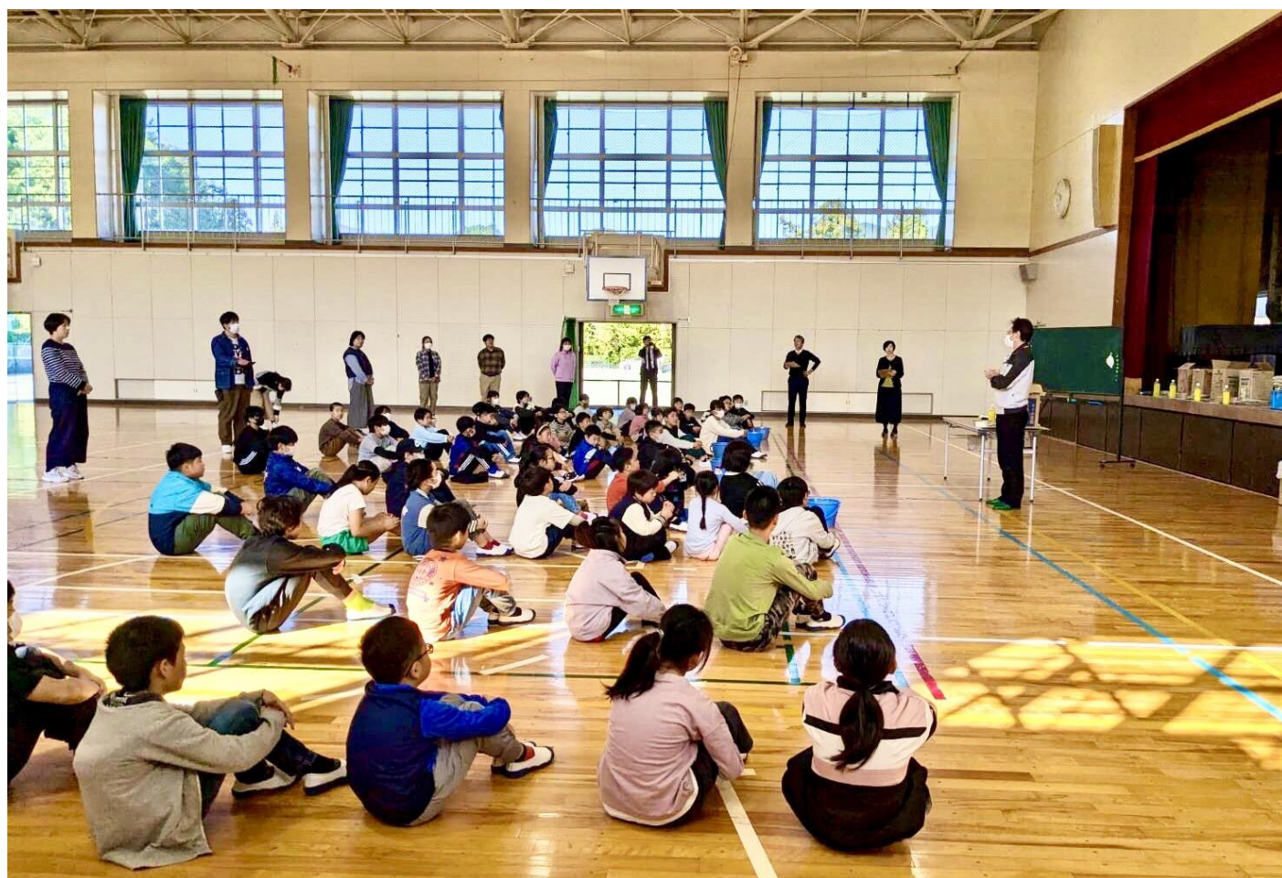
「七保小学校防災出前講座」より(関連記事 p1)