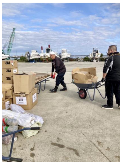
サテライト新設の準備

2泊3日を1クールとし、10月16日～18日（第1便）、10月30日～11月1日（第2便）、11月13日～15日（第3便）の3つのクールに分かれ実施され、当会職員は第1便に2名、第2便に3名が参加しました。