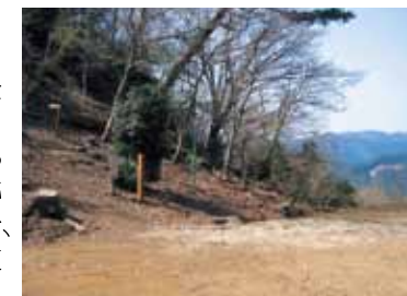
阿曾駅と林道終点の分岐

林道終点より右に折れ 10分程度下ると阿曾駅方面との分岐に出ます。この道はかつての大理石を運んだ木馬道でありJR阿曾駅に通じており眼下に採石跡が見え、更に10分で「網掛山」と「もみじ谷」の分岐が松林にあり、網掛山には自然の林を30分で登頂できます。もみじ谷へは分岐を下ると大理石・石灰採石跡の広場(第四切羽跡)で、もみじ谷西口の遊歩道へと通じています。